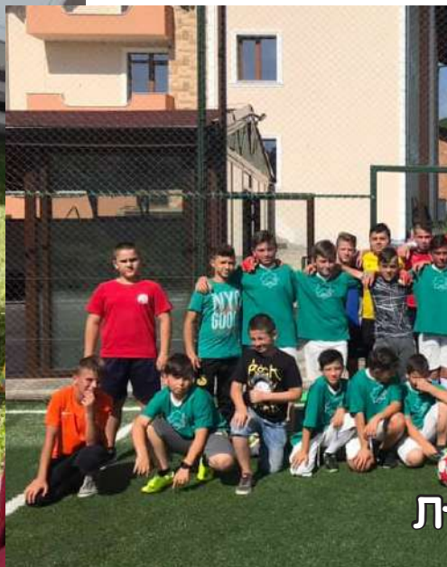
Лъжница и Кочан